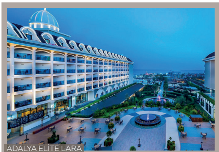
ADALYA ELITE LARA